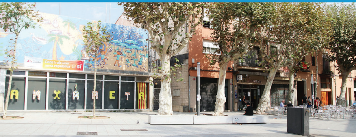
La plaça de l'Havana, el cor del barri