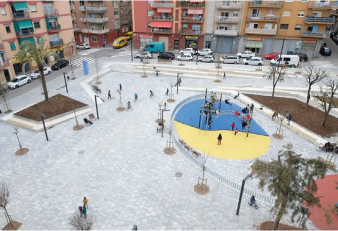
La plaça Joan XXIII de Rocafonda, renovada l'últim any