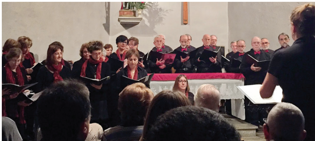
La coral, en acció, en un dels seus recitals