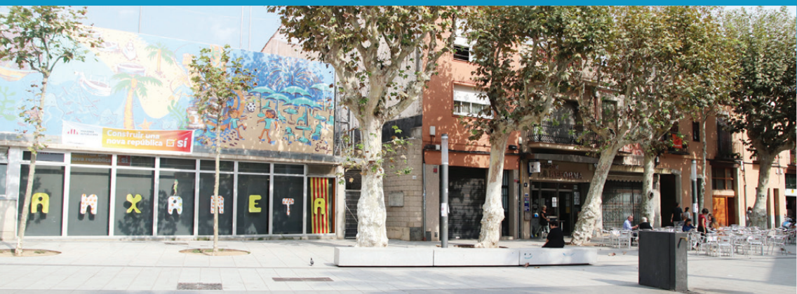
La plaça de l'Havana, el cor del barri