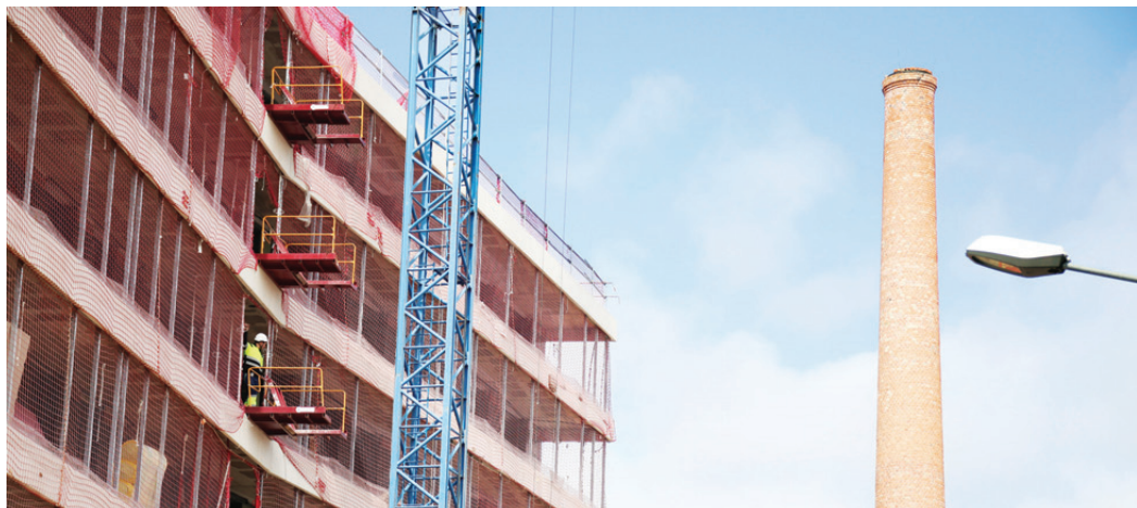
Les obres de desenvolupament de l'Eix Herrera